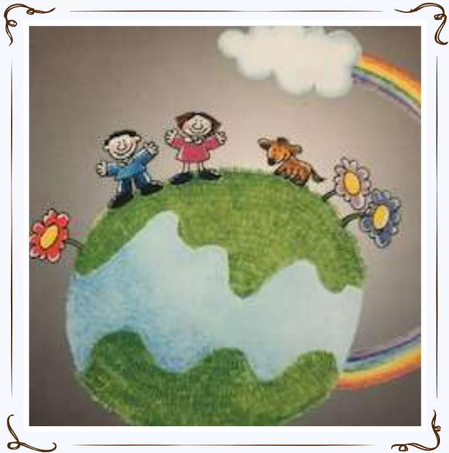
La creazione del mondo