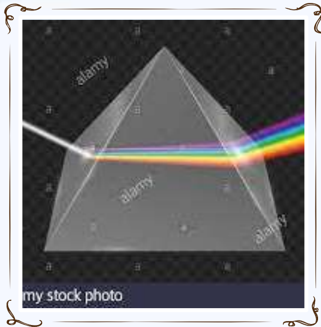
Il Prisma di cristallo E la scoperta di newton