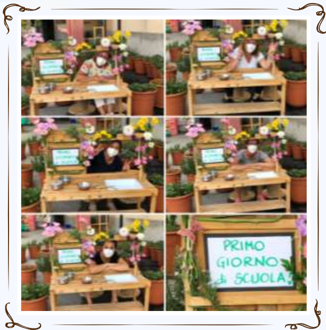
LA SCOPERTA DI NUOVI AMBIENTI E ORGANIZZAZIONE