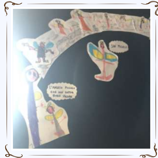
La scoperta della vera Luce... Gesu